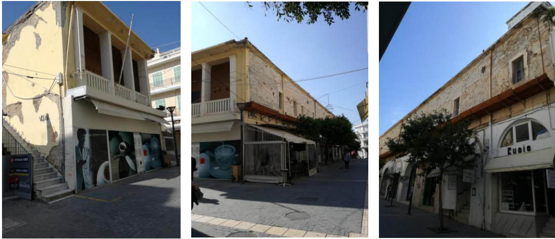
ABK 6 Ηρακλείου, Τμήμα Α