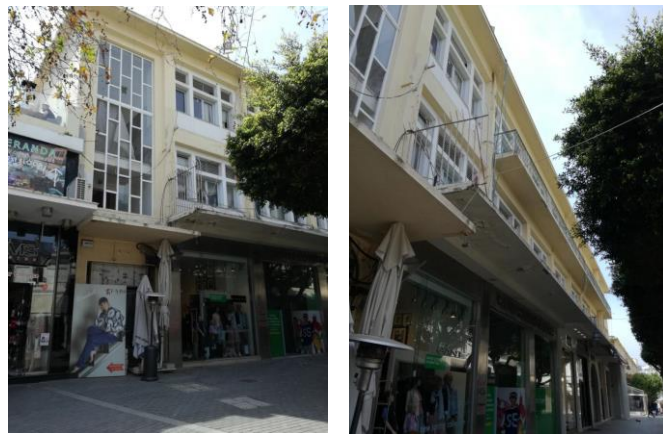
ABK 6 Ηρακλείου, Τμήμα Β

Το ακίνητο παλαιότερα αποτελούσε τμήμα του συγκροτήματος των κρατικών σιταποθηκών που κατασκεύασαν οι Ενετοί στο τέλος του 16ου αι, σε συνέχεια της κεντρικής πύλης και επί του βυζαντινού τείχους της πόλης. Η ακεραιότητα του συγκροτήματος διαταράχτηκε τόσο με τους βομβαρδισμούς κατά την περίοδο του Β΄ Παγκοσμίου Πολέμου, όσο και με την διάνοιξη της οδού Τ. Τζουλάκη, η οποία χώρισε το ακίνητο σε δύο τμήματα εκατέρωθεν αυτής. Μεταπολεμικά, η αποκατάσταση του ακινήτου και η τμηματική ανοικοδόμησή του, έγινε με σκοπό την στέγαση της Αστυνομίας. Η Υπηρεσία παρέμεινε στο ακίνητο μέχρι και το 2009 οπότε και μεταφέρθηκε στο νέο Αστυνομικό Μεγάρο στην Αλικαρνασσό Ηρακλείου.