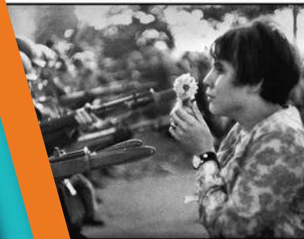
Αντιπολεμική ποίηση και τραγούδι