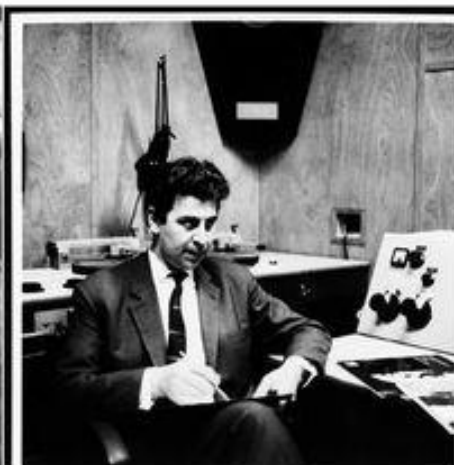
Μίκης Θεοδωράκης οι δρόμοι του αρχάγγελου